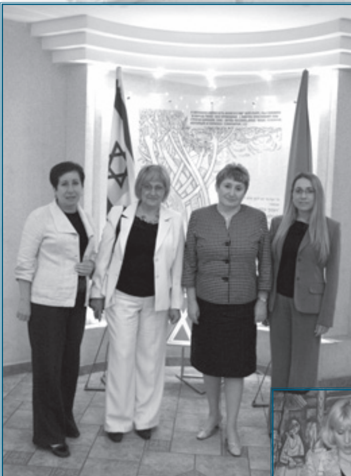
Второй секретарь посольства Израиль в Украине Фрида Галь