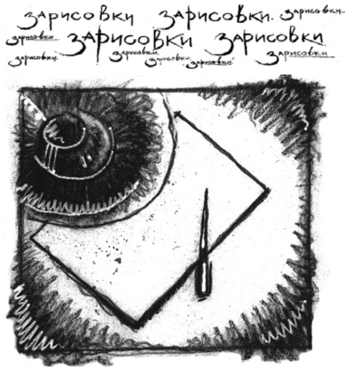
Рис. Александра Винокур