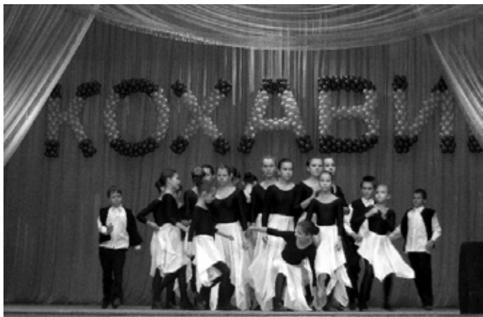
Танцевальный ансамбль “Амелия” Сумского благотворительного фонда “Хесед Хаим”

Каждый год фестиваль «Кохавим» становится не только отчетом творческих коллективов и исполнителей еврейских организаций Харьковского региона, но и встречей старых друзей и единомышленников. Ведь мы, сотрудники различных еврейских организаций, много лет знакомы и, каждый на своем месте, делаем общее дело - возрождаем и развиваем наши еврейские общины. И возрождение еврейской культуры- это одно из важнейших направлений нашей работы.